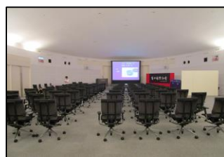
〈オークション会場〉