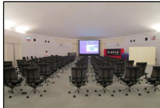
〈オークション会場〉