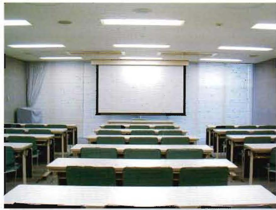
Conference Room 5