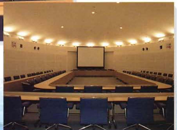
Double Horseshoe Style

●通常80席 ●80 seats (standard) ●통상 80석 ●通常80个座位