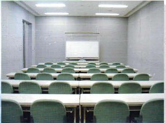
Conference Room 2