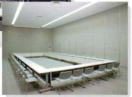
Variation of Large Conference Room

通常306席の会議室、3分割も可能でさまざまなスタイルの学会・大会に対応できます。