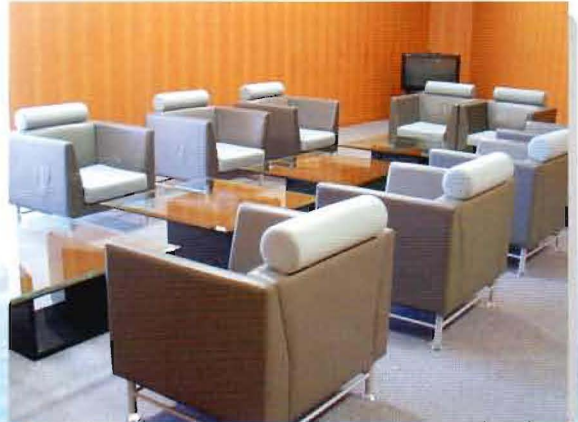
Special Conference Room